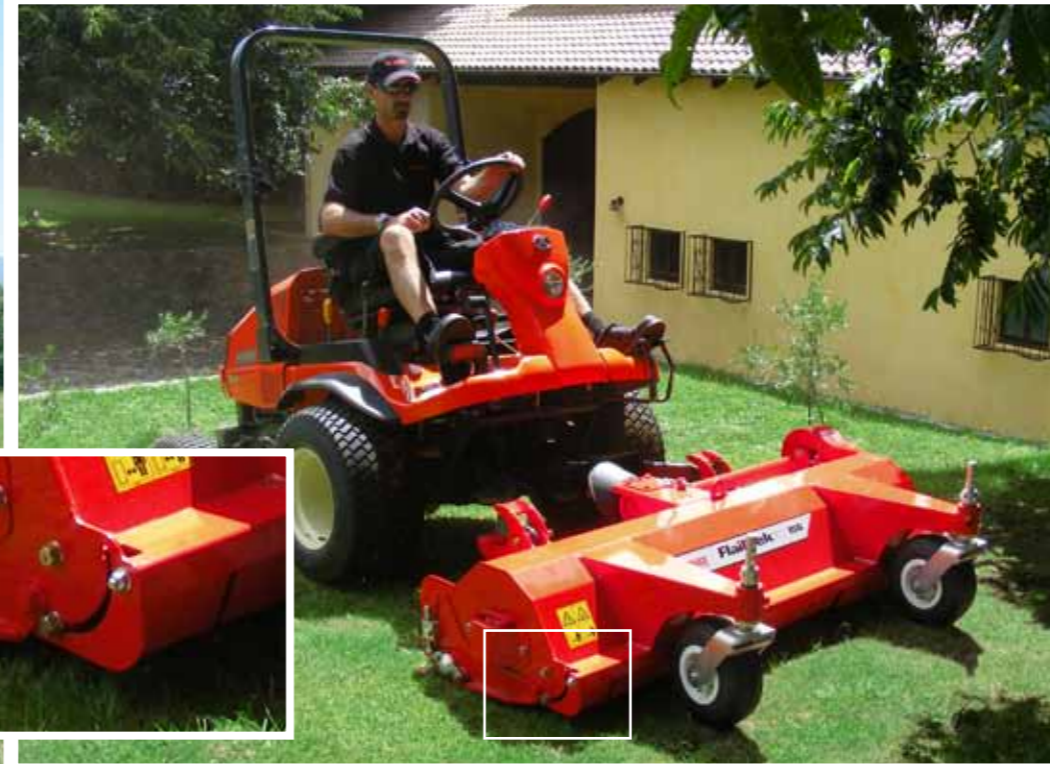
Pour une tonte d'herbe courte, le sélecteur est en position fermée.