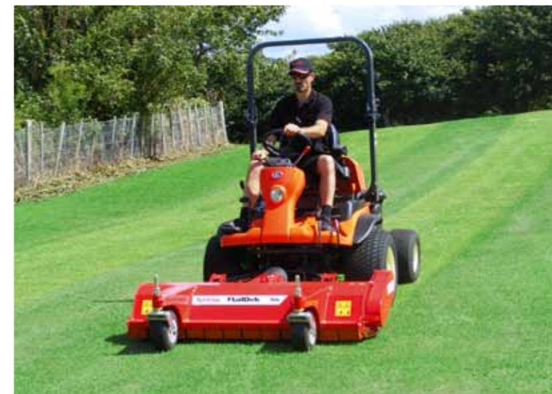
La FlailDekFX donne un remarquable effet de bandes.

La maintenance aisée est aussi un des paramètres clés de Trimax. Les courroies peuvent être tendues et les paliers graissés sans déposer du carter. Pour une utilisation sans souci, la hauteur de tonte peut être rapidement changée en utilisant les réglages de hauteur. La qualité apportée dans les moindres détails par Trimax aboutit à une tondeuse opérationnelle dans une grande variété d'applications, et fiable durant de longues années.